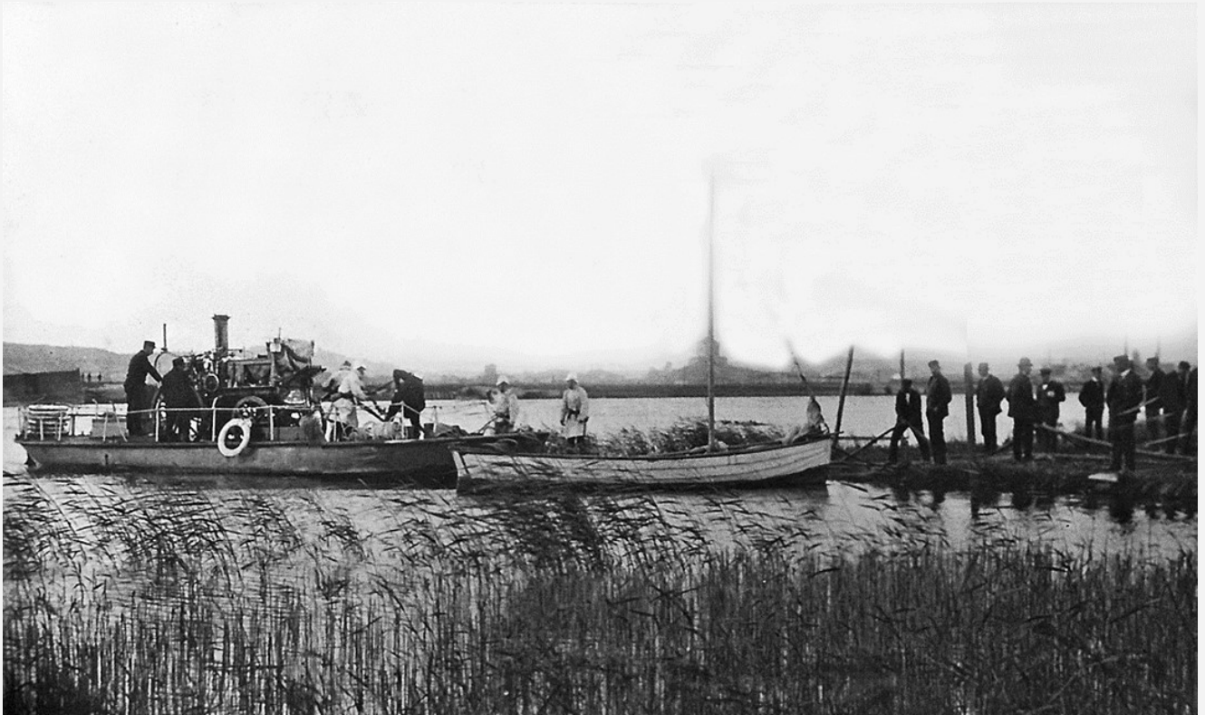
Gamla flodsprutan vid eldsvådan i Tingstads träförädlingsfabrik.