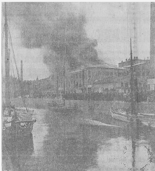
Vid Rosenlundsbrandens början.

Dessbättre uteblef en sådan katastrof. Vid ½5-tiden syntes den öfverhängande faran på detta håll vara aflägsnad, tack vare de kraftiga släckningsåtgärderna.