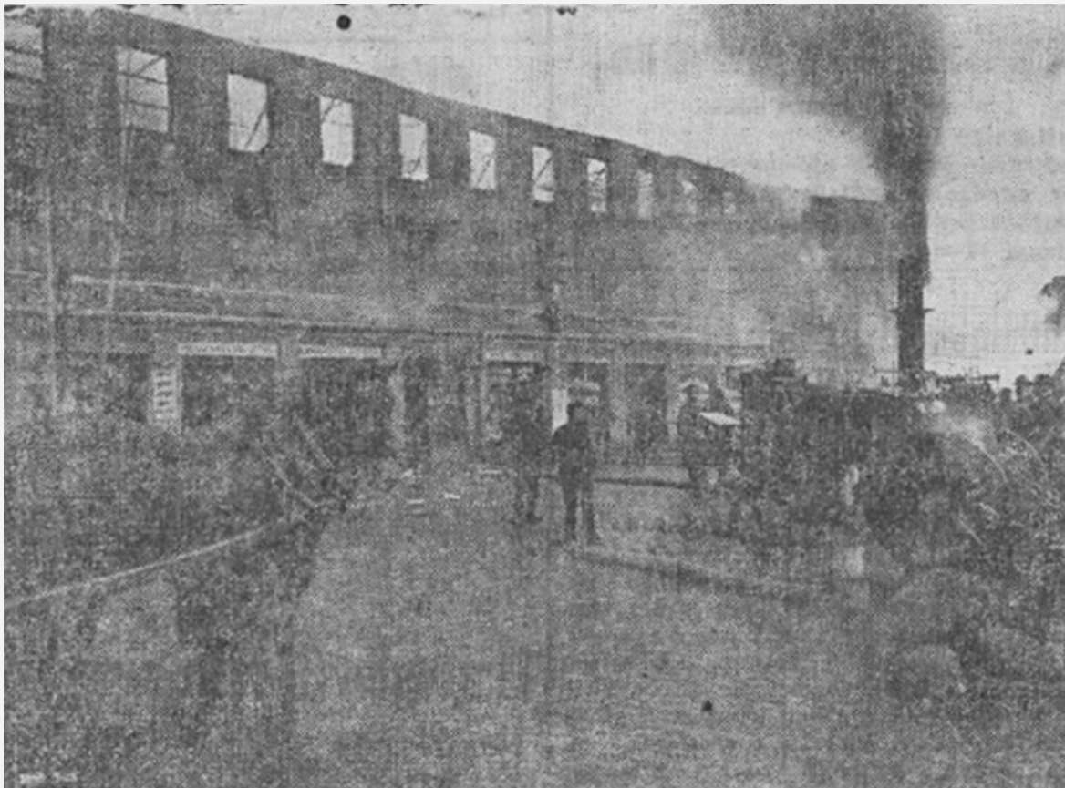
Rosenlund i ruiner.

Af byggnaden återstå, utom de af elden mindre härjade flyglarna, endast de nakna tegelmurarna. I ruinerna sticka de glödande resterna af maskiner och redskap upp.