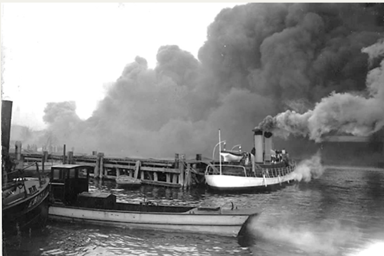
Flodsprutan i arbete.

Det dröjde ej heller länge, förrän samtliga magasinslängorna stodo i ljus låga.