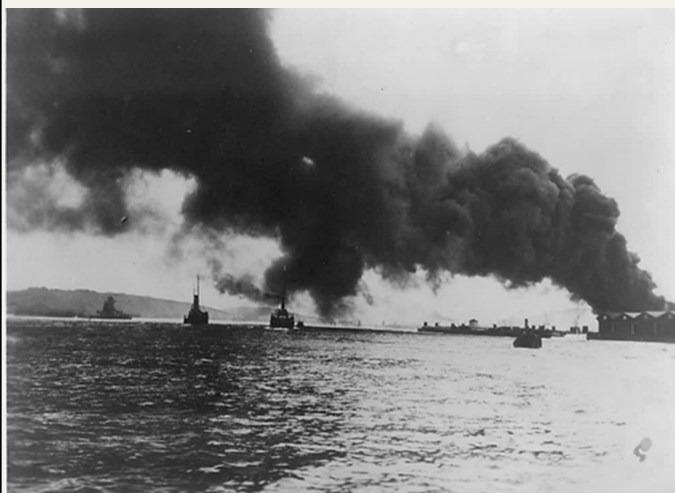
De väldiga rökmolnen svepa fram.

Detta kunde ju blott ske på ett sätt: genom att vattenbegjuta cisternerna och därigenom hålla temperaturen nere, så att ingen explosion inträffade. En mängd slangar riktades följaktligen mot cisternerna, och det lyckades veckligen de duktiga brandmännen att hålla elden borta, men det var tydligen ej långt ifrån att de misslyckades. Den närmaste cisternen blev nämligen så upphettad att det fräste från sidorna när vattnet sprutades på den.