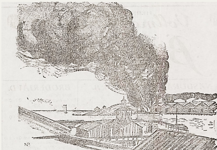
Eldsvådan, sedd från Klippan vid 10-tiden.

På middagen voro fortfarande fem ledningar från flodsprutan i gång vid brandstället. Helt och hållet är elden ännu icke dämpad, men den är definitivt begränsad. Den tjocka svarta röken har avtagit, och en ljusare och tunnare rök stiger upp från det eldhärjade området.