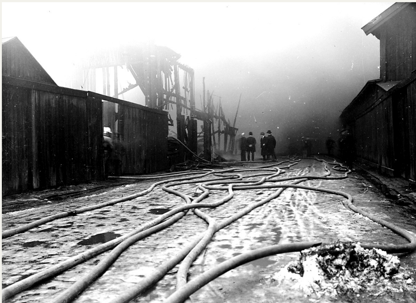
En av eldgränserna.

Det berättas, att elden spritt sig med sådan fart att, då brandkåren högst två minuter efter allarmen svängde ut på Första Långgatan, stod redan hela himlen röd av flammorna från branden och vid framkomsten var faktiskt hela det område, som nu är avbränt, i eld och lågor.