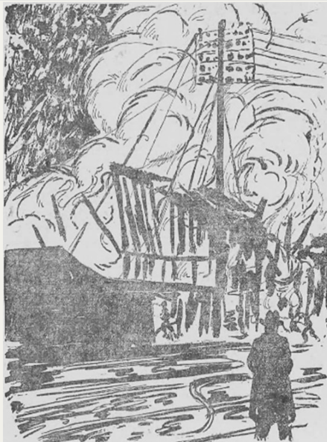
När elden rasade som värst. (Teckning af K.G. Ringblom)

Lyckades man på ett ställe dämpa lågorna, slogo de så mycket mera intensivt upp på ett annat. Samtidigt med släckningsarbetet fick man också ett drygt arbete med att söka rädda hästarna i de på området och i närheten belägna stallarna.