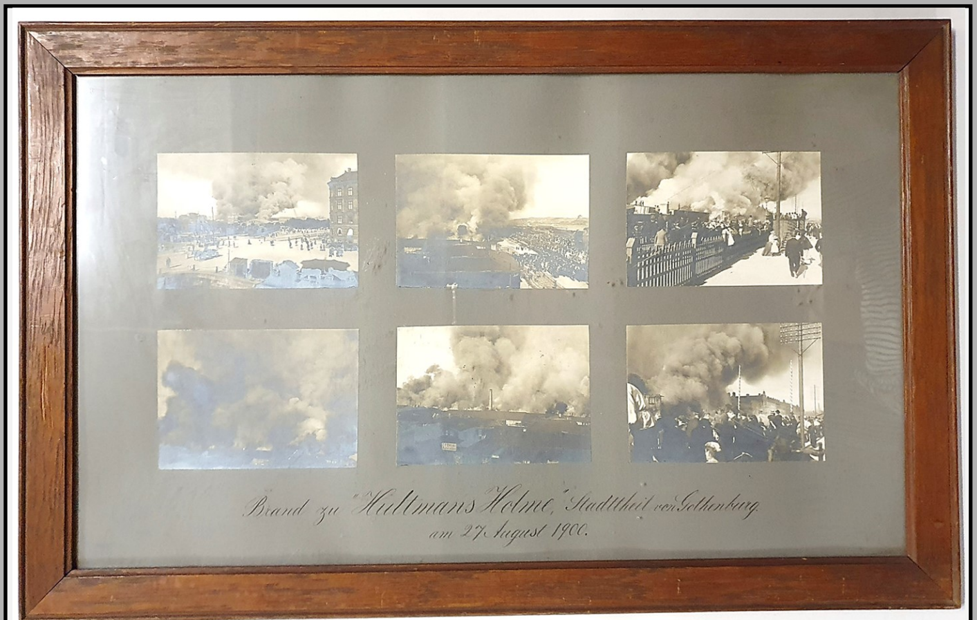
GMA:8877 Brand zu "Hultmans Holme", Stadtteil von Gothenburg am 27 August 1900