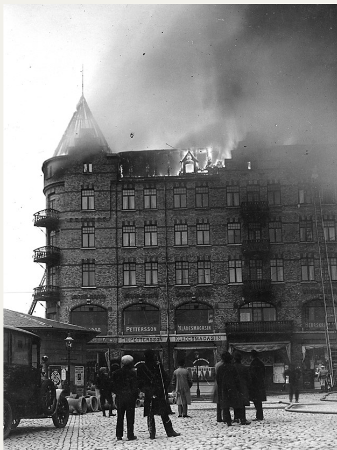
Vindsvåningen bildade ett enda jättebål.

En av nattvakterna alarmerade brandkåren, medan den andre varskodde polis, och inom få minuter var hela huset på benen. Med visslingar, rop och slag på dörrarna väcktes de sovande i de underliggande våningarna. Människorna rusade ut, de flesta endast halvklädda, för att sätta sig i säkerhet.