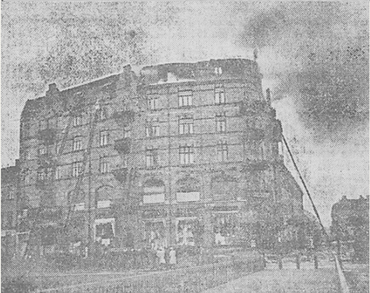
När branden rasade som häftigast.

Det brunna huset var försäkrat för 1,200,000 kronor.