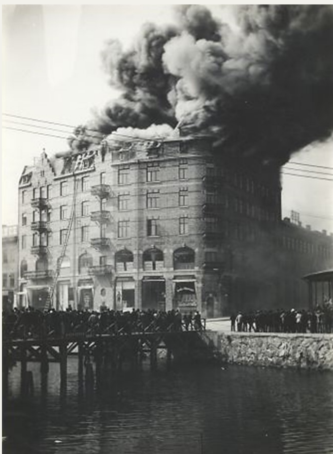
GMA:7739:59 Eldsvådan i Götahallen 1896-07-24

Ångsprutans hufvudslang sprack och måste ersättas med en annan och därefter kunde ledningarna från densamma komma i värksamhet dels på den stora brandstegen på Kungstorget och dels från taket af ett närgränsande hus.