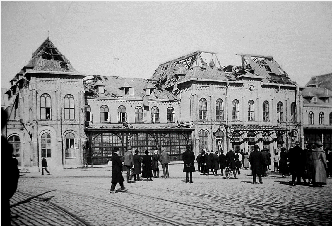
Stationshusets fasad mot Drottningtorget efter branden.