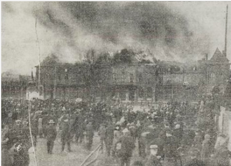
Hela takvåningen ett flammande bål.

Lågorna flammade nu ut även från mittpartiet och västra flygeln, och den lätta vinden förde röken över torget. Elden lyste igenom den transparanta urtavlan på stationsklockan. Klockan stannade på 4,5 och sedan den stått så en stund syntes minutvisaren plötsligt falla ned till halv 5-läget.