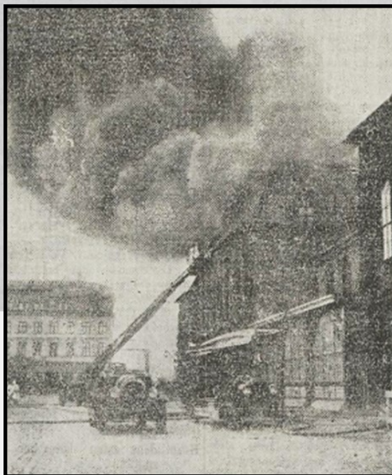
Eldhärden angripen från Drottningtorget.

GÖTEBORGS HANDELS- OCH SJÖFARTSTIDNING 1923-03-15