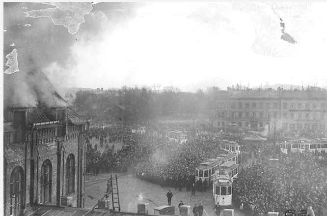
DET BRINNANDE STATIONSHUSET FRÅN BAKSIDAN. T. h. synes folkmassan på Drottningtorget.