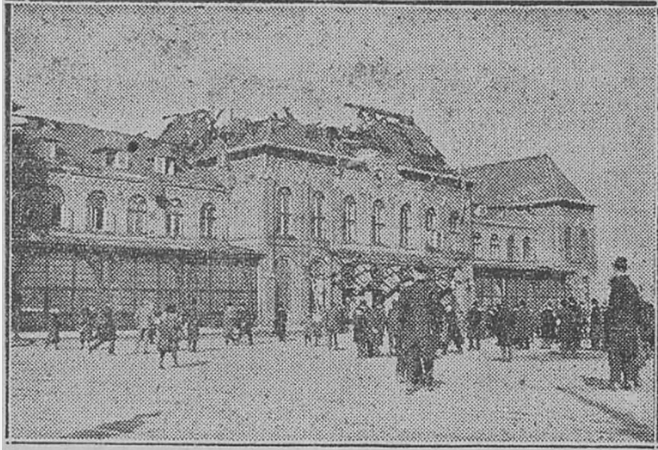
DET ELDHÄRJADE STATIONSHUSET EFTER SLÄCKNINGSPÅRBEITETS SLUT

Beslut i dag om hur restaureringen skall komma att utföras.