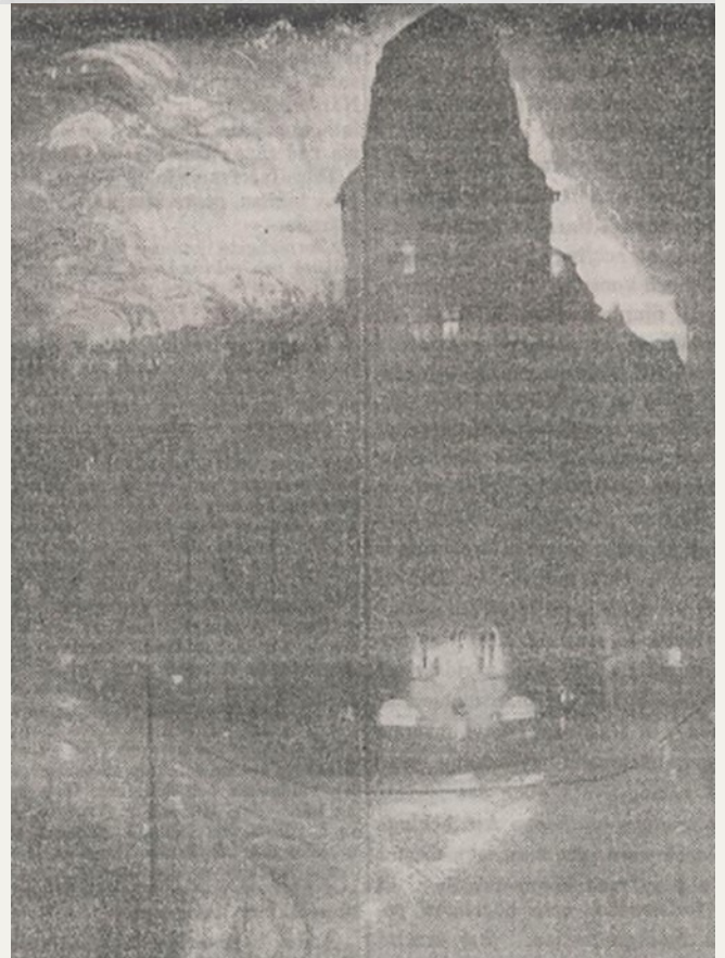
Tornet omvärt av lågor.

Efter det ångsprutan anlönt, voro nio slangledningarna utlagda. Trots de stora vattenmassorna, som slungades in över den stora eldhärden, vann elden oupphörligt terräng, och en kvarts timma efter brandkårens ankomst hade lågorna spritt sig över bägge flyglarnas vindsvåningar.