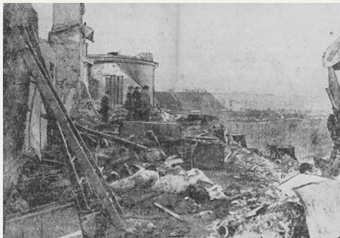
En bild från det härjande vindsområdet.