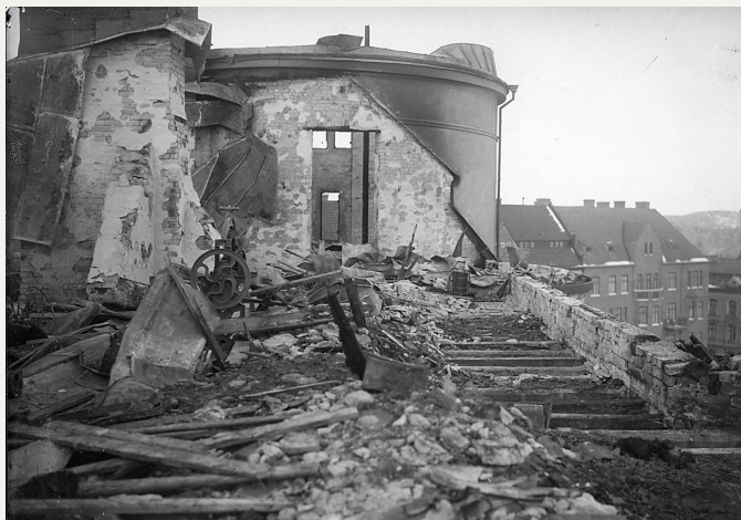
På taket efter branden.