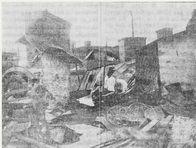
Bland brandmurar och bråte.

Det härjade byggnaden äges af Hisingstads tomtaktiebolag och är försäkrad för bortåt en half million kronor i Ocean. Naturligtvis är det svårt att för närvarande exakt uppgifva skadans omfång. Emellertid torde densamma gå lös på ett 100-tusentals kronor.