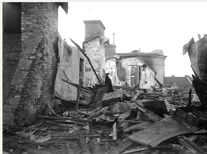
En bild från det härjande vindsområdet.

Under eldsvådan stodo många tusen människor samlade på Vasaplatsen, Vasa Kyrkoplän och de kringliggande gatorna åskådande det praktfulla skådespelet, och under hela söndagen rådde en formlig folkvandring till brandstället, där man med största intresse åsåg, huru brandsoldaterna vandrade omkring på det barlagda vindsgolvet.