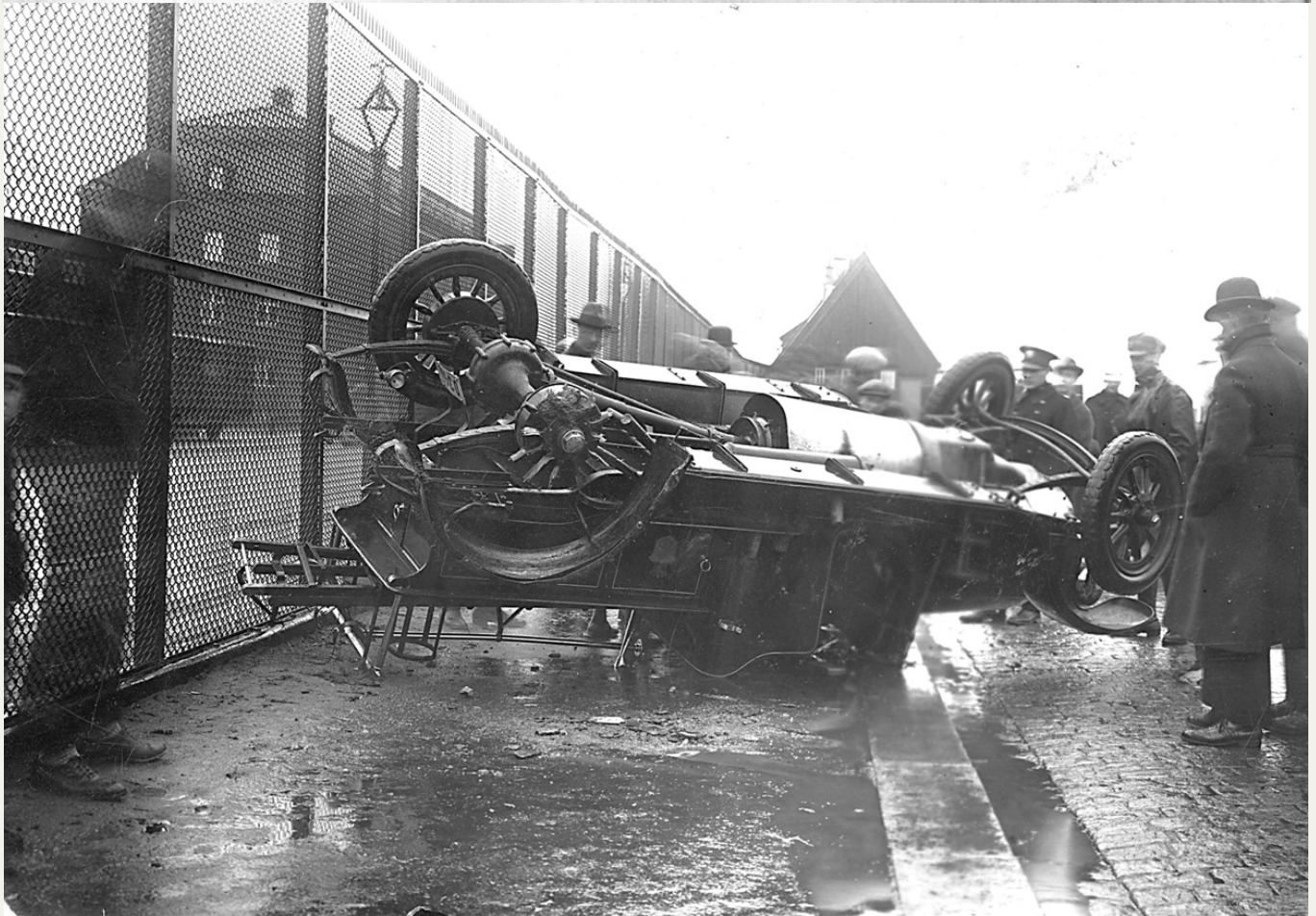
Den havererade brandbilen

Allvarligt olyckstillbud vid utryckning till Lundby i går.