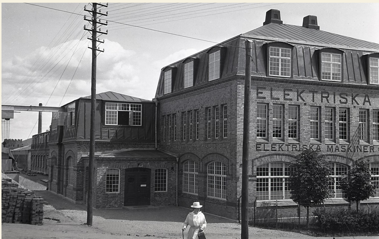
Clara Eck håller kameraväskan medan Carl Eck fotar av sin fabrik år 1919.

Foton från G-P - "Sorgebarnet" mellan stationen och Partille centrum