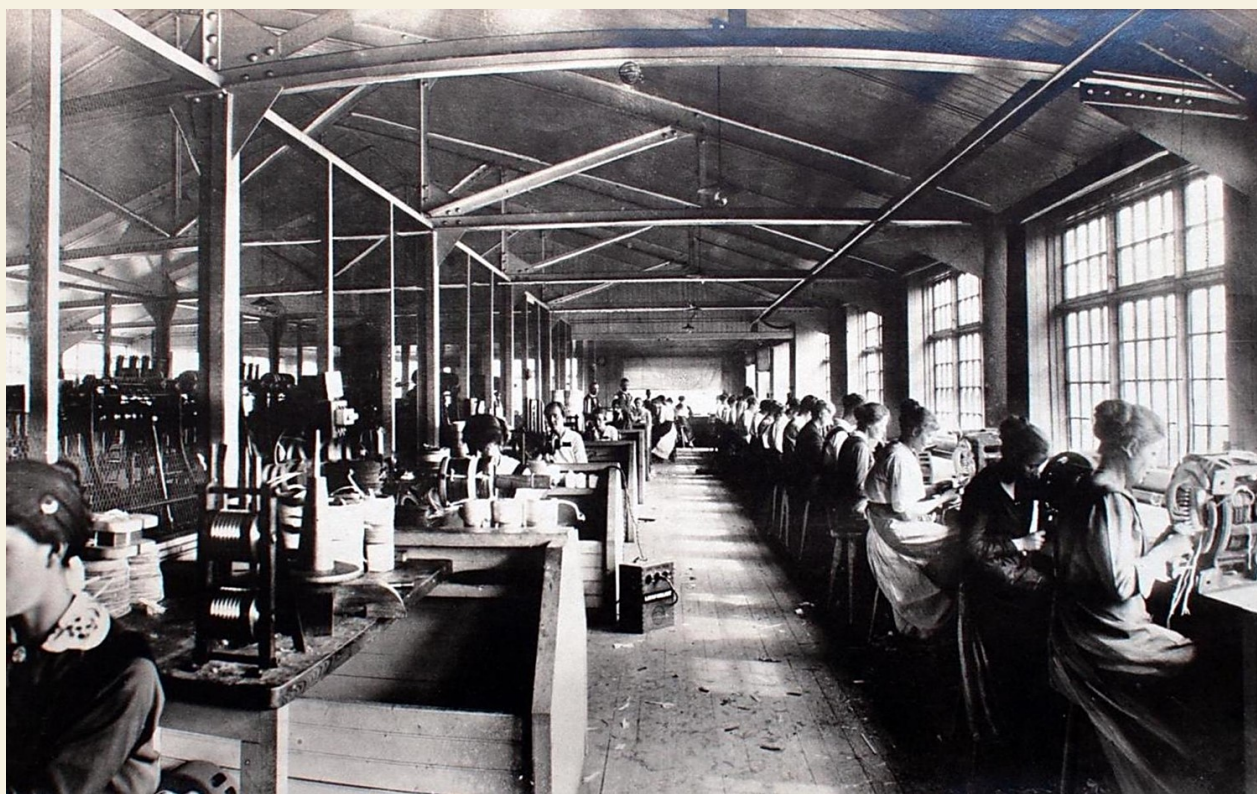
Foto från en lindare avdelning för små växelströmsmotorer i fabriken 1920.