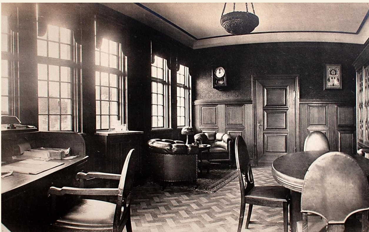
Direktören Carl Eck fotograferade även sitt kontor, 1920 såg det ut så här.