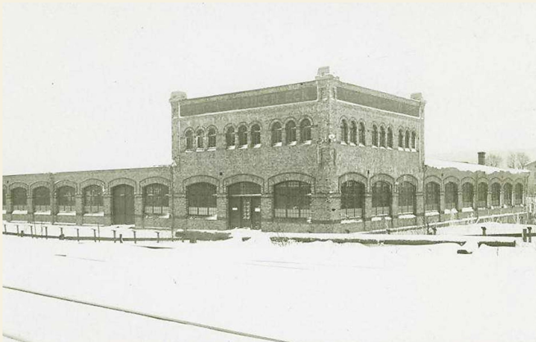
Motorfabriken Eck omkring 1908.

Till detta kompletterar lite information och bilder från tiden före och efter branden, vilka är hämtade från olika artiklar, "Nätet", och föreningsarkivet.