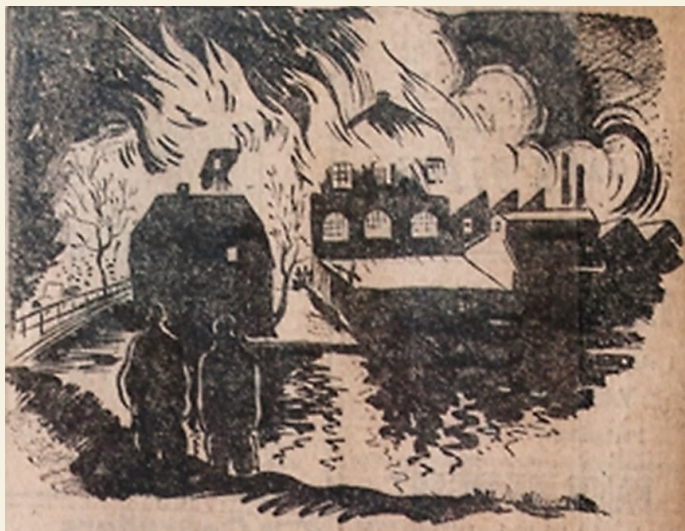
Jättelågor speglade sig i ån.