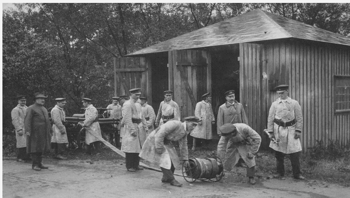
Den första brandstationen uppfördes vid Kyrkbron (Folkbron)

Efter det att brandstationen i Öjersjö stod klar 1995 fick stationen i Partille centrum vara kvar en tid till, som deltidstation, men lades till slut ned den 1 september 1997. Brandstationen försvann i samband med att Allums köpcentrum byggdes.