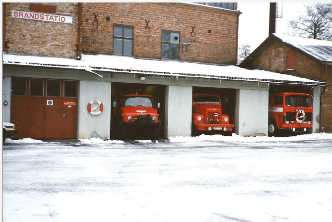
Mölnlycke brandstation (Fabriken)