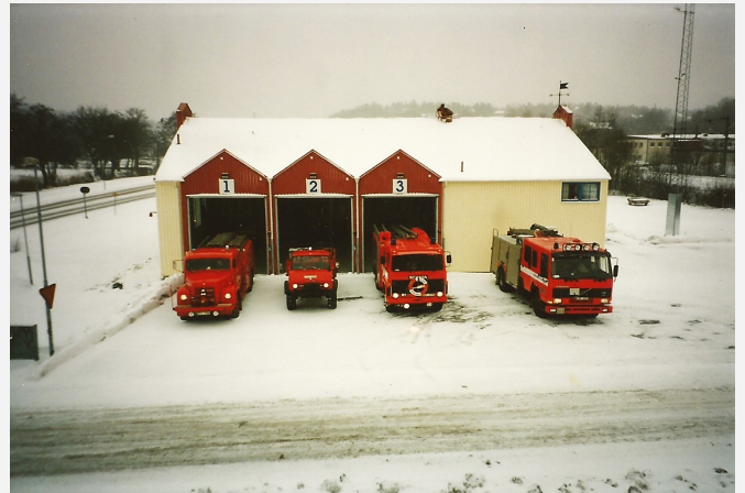
Mölnlycke brandstation (Busstorget)