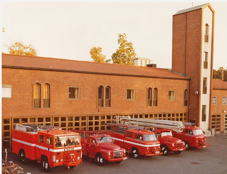
Nya Partille brandstation invigdes 1956