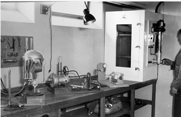
Två mindre källarutrymmen avsattes för en rökskyddsverkstad vid uppförandet av Lundby brandstation.

Lundbys nya brandstation ersatte den gamla vid Pumpgatan och brandstation i Majorna som då drogs in.