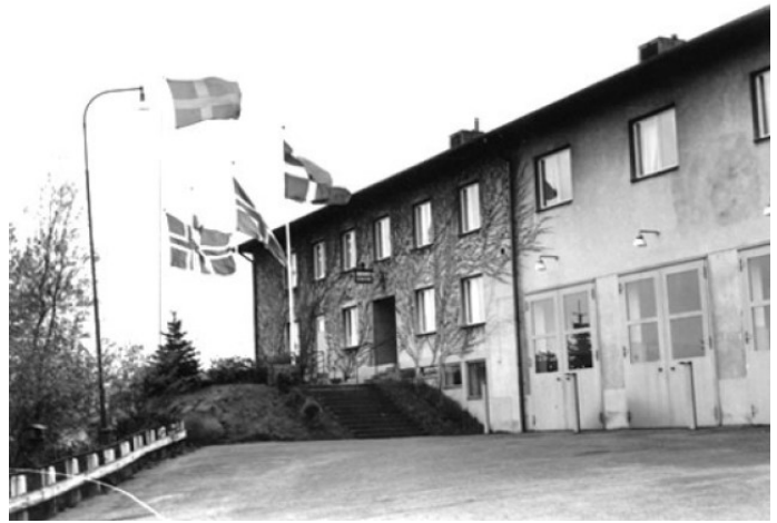
Lundby brandstation vid Nordiska Brandmästerskapen 1957

I Stockholm 1969 vann Kent Oskarsson sitt första "Nordiska Brandmästerskap" i 3000 meter löpning på segertiden 8.32.5 vilket blev nytt nordiskt rekord. Kent Oskarsson löparinsatser genom åren blev enastående där man bland andra meriter kan nämna, klubbmästare i ett antal grenar, mängder av segrar i Brand-SM, ett flertal guld och nordiska rekord i "Nordiska Brandmästerskapen".