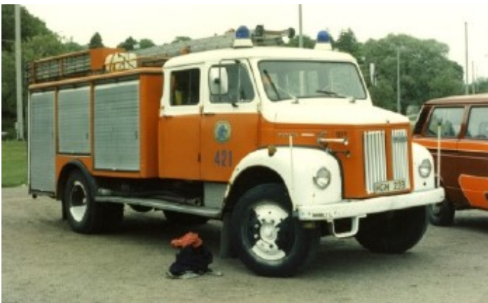
Larmkläder står redo vid idrotten intill brandbilen

I nostalgin kan man gräva länge när man blickar tillbaka på idrottshistorien.