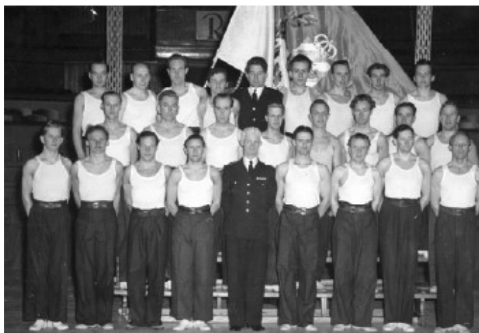
Gymnastik-truppen deltog vid Lingiaden 1949